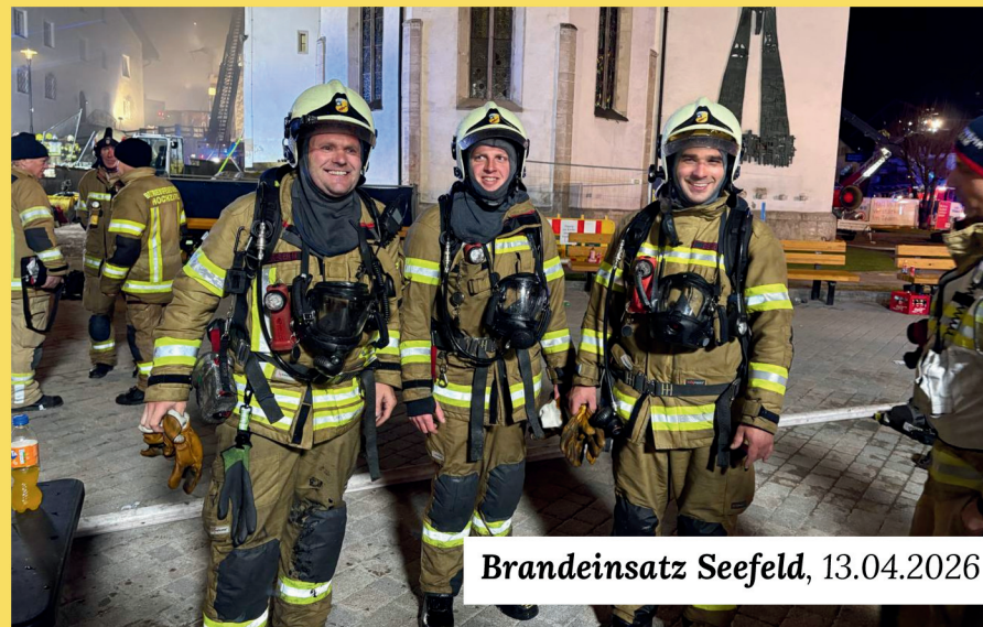
Brandeinsatz Seefeld , 13.04.2026