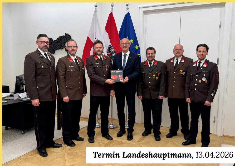
Termin Landeshauptmann , 13.04.2026