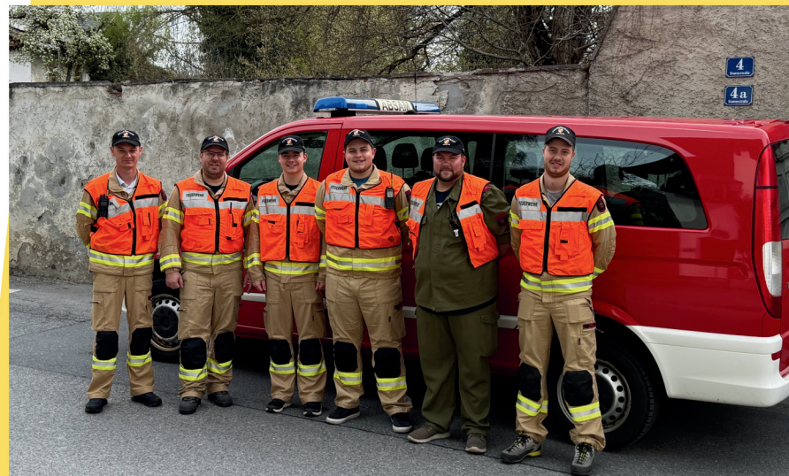
Verkehrsregelung Erstkommunion , 12.04.2026