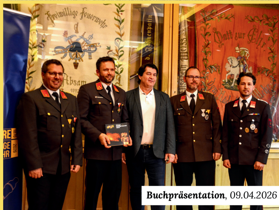
Buchpräsentation , 09.04.2026